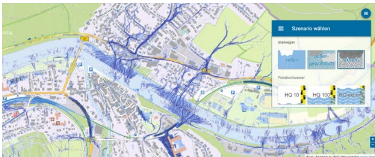
Auszug aus der Starkregensimulation für Neckargemünd, Firma Geomer https://www.starkregengefahr.de/baden-wuerttemberg/gvv-neckargemuend

Wenn Sie das verhindern möchten, sollten Sie grün wählen.